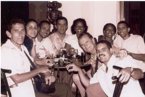
Fotógrafos reunidos en la inauguración de la exposición.

En la galería Luis Guas Artilles del Museo de Historia Natural, en el marco del III Festival de Imagen de la Naturaleza se inauguró esta exposición el día 28 de Mayo, patrocinada por Caja Madrid, tuvo la asistencia de un numeroso grupo de fotógrafos y amantes de la naturaleza.