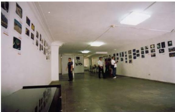
Obras expuestas de los participantes en el Festival