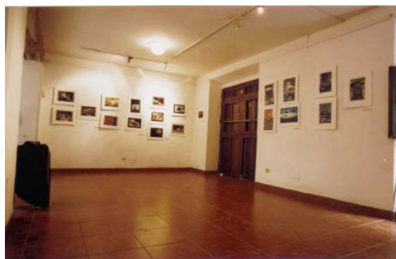
Exposición en la Casa Alejandro de Humbolt

También estuvieron presentes las obras de los ganadores de la pasada edición del Festival.